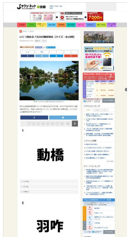
右)「Jタウンネット」にトイダスで作成したクイズを貼りつけた(APIで呼び出し)画面