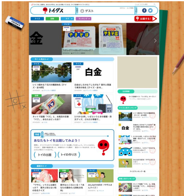
トイダストップ画面(PC版)