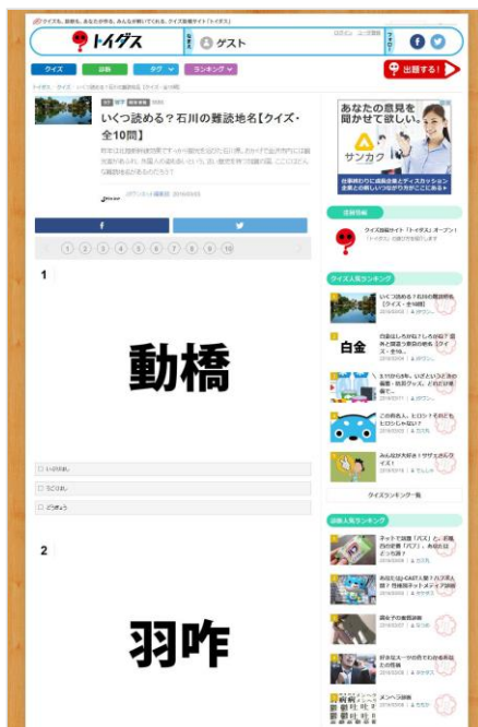
左)トイダス クイズ解答画面